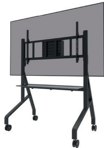
FL50-575BL1 Rozmiar ekranu: 65-110" Udźwig: 125 kg Wysokość: 129-139 cm