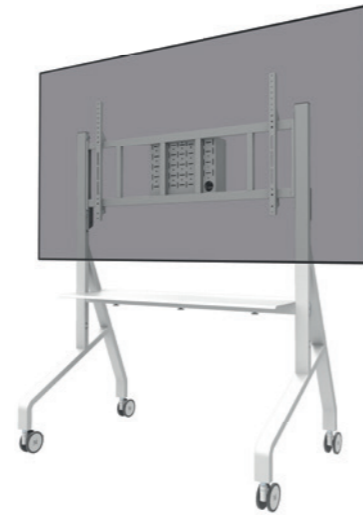
FL50-575WH1 Rozmiar ekranu: 65-110" Udźwig: 125 kg Wysokość: 129-139 cm

Akcesoria: AV2-500BL/WH: Uniwersalny zestaw do wideobarów AWL-250BL18: Zestaw rozszerzający VESA 800 ABL-875: Blokada hamulca do kół