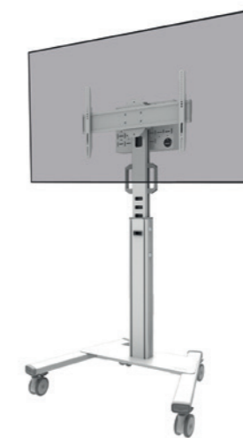
FL50S-825WH1 Rozmiar ekranu: 37-75" Udźwig: 70 kg Wysokość: 104-157 cm