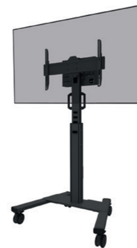
FL50S-825BL1 Rozmiar ekranu: 37-75" Udźwig: 70 kg Wysokość: 104-157 cm