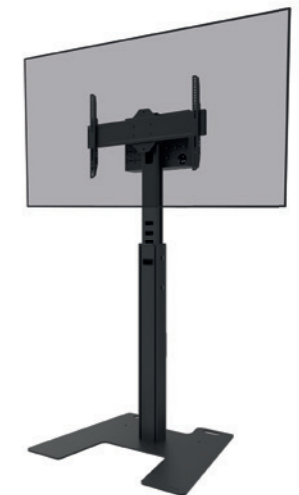
FL45S-825BL1 Rozmiar ekranu: 37-75" Udźwig: 70 kg Wysokość: 104-157 cm